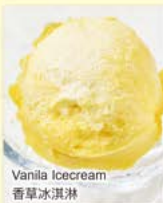
Vanilla Icecream 香草冰淇淋