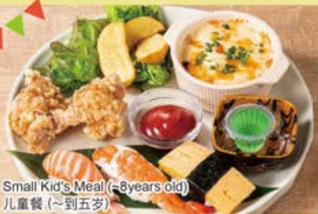
Small Kid's Meal (~8years old) 儿童餐(~到五岁)