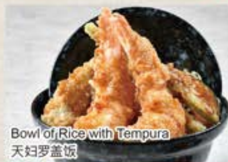
Bowl of Rice with Tempura 天妇罗盖饭