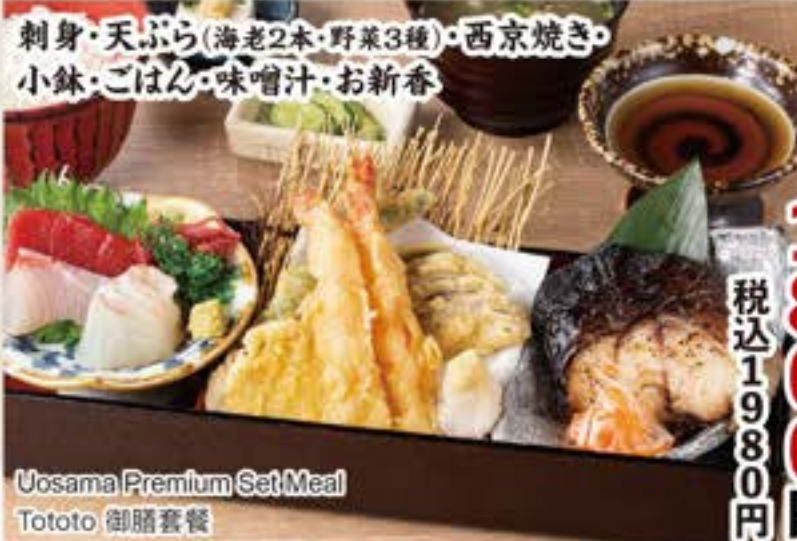
Uosama Premium Set Meal Tototo 御膳套餐