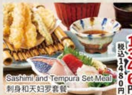
Sashimi and Tempura Set Meal 刺身和天妇罗套餐