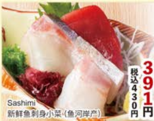
Sashimi 新鮮魚刺身小菜(魚河岸産)