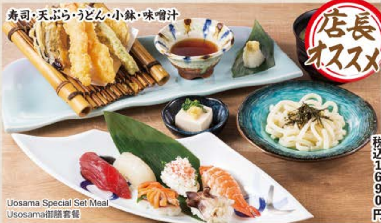
Uosama Special Set Meal Uosama御膳套餐