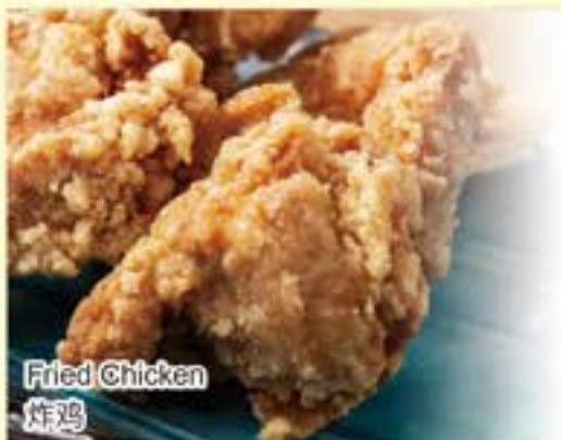
Fried Chicken 炸鸡