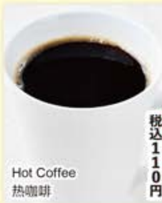
Hot Coffee 热咖啡