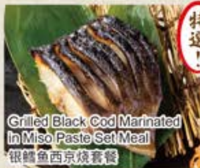
Grilled Black Cod Marinated in Miso Paste Set Meal 银鱈魚西京焼套餐