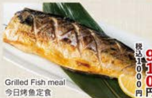
Grilled Fish meal 今日烤鱼定食