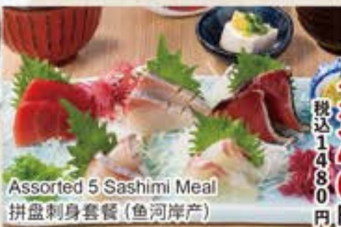
Assorted 5 Sashimi Meal 拼盘刺身套餐(鱼河岸産)