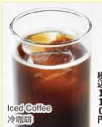
Iced Coffee 冷咖啡