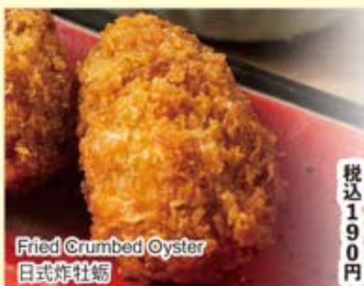
Fried Crumbed Oyster 日式炸牡蛎